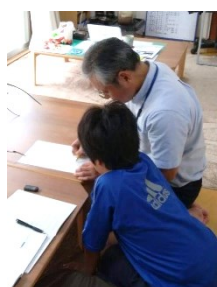
一人一人に寄り添い