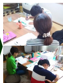
丁寧なサポートで